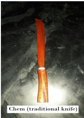
Chem (traditional knife)

chem [tʃem] Noun. a traditional knife mostly used by males at dance; एक पारंपरिक चाकू जो ज्यादातर पुरुषों द्वारा नृत्य में उपयोग किया जाता है.