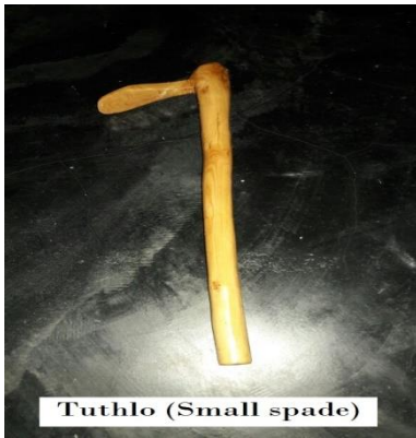
Tuthlo (Small spade)

tuthlo [tut h lɔ] Noun. axe made of bamboo; बाँस की कुल्हाड़ी.